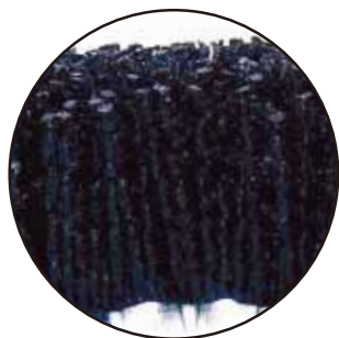
砥粒入りナイロン線材

ブラシ線材の消耗度が極めて低く、長時間の使用が可能となり、交換頻度が減ることで、作業性、経済性が大幅に向上しました。