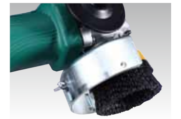
ホイルブラシ装着時