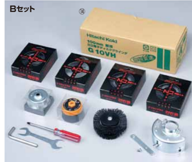
Aセットにグラインダが含まれたセットです。 ※機種が変更になる場合があります。